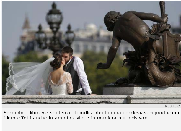
Secondo il libro «le sentenze di nullità dei tribunali ecclesiastici producono i loro effetti anche in ambito civile e in maniera più incisiva»

ROMA L'ultima vip, in ordine di tempo, a voler chiedere l'annullamento del matrimonio alla Sacra Rota è la showgirl Valeria Marini, ad appena un anno dalle nozze. Ma la Sacra Rota non è, come molti ritengono, appannaggio per soli vip o ricconi vari. Anzi, è addirittura prevista una forma di patrocinio gratuito e un Patrono stabile per coloro che non dispongono di un avvocato di fiducia.