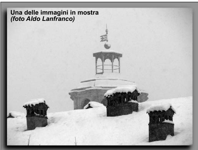
Una delle immagini in mostra

Ogni anno, piacevolmente, il Museo Civico "A. Olmo" di Savigliano si propone come specialissima "tappa" nel consueto susseguirsi di appuntamenti natalizi in città.