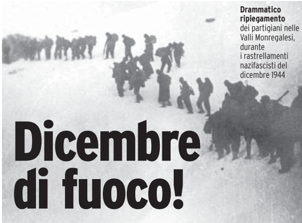
Drammatico ripiegamento dei partigiani nelle Valli Monregalesi, durante i rastrellamenti nazifascisti del dicembre 1944